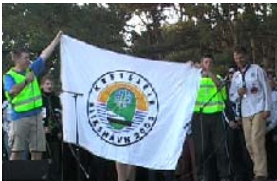
Leirflagget kom til rette under avslutningsleirbålet.

I går ettermiddag ble endelig leirflagget funnet. Ryktene hadde lenge svirret om hvem som hadde tatt det, og ett av ryktene var at leirsjefen selv hadde tatt det.