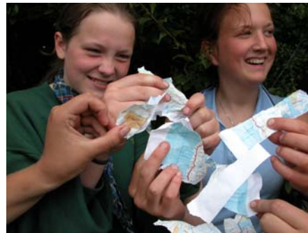
To fjøsnisser viser hva som er riktig å gjøre med kartet.

Leiren var merket feil i forhold til veien, og dette skapte mye forvirring med å orientere seg. Mange patruljer gikk feil i begynnelsen. Et dårlig utgangspunkt for en haik, da kartet er svært vesentlig!