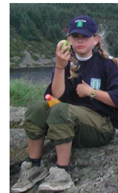
Haikematen fikk mye skryt.

Les haikedeltakernes egne beretninger i morgen