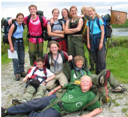
Hauk og Falk fra 1. Fjøsanger ble første gruppe på kontrollpost 2