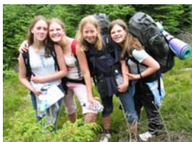
Ørn og Gaupe fra 4. Bergen - Sandviken.