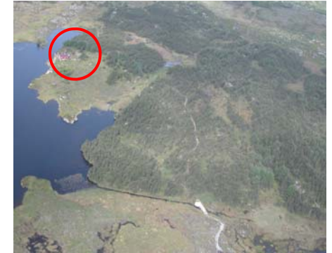
Flyfoto som bl.a. viser overnattingsområdet for haiken