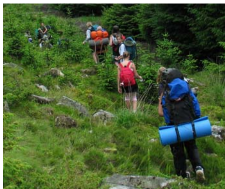
Mange forvillet seg inn i den meget tette skogen i området, inkludert disse speiderne.