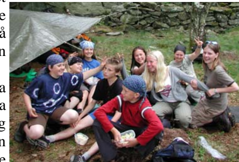
Ulvemat, 1. Skjold