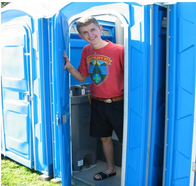
Das(s) Sjef i sitt rette element...

Når det er varmt, er det viktig å drikke mye. Dette fører igjen til hyppigere